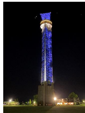
クロスランドおやべ