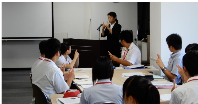
講座等による普及促進