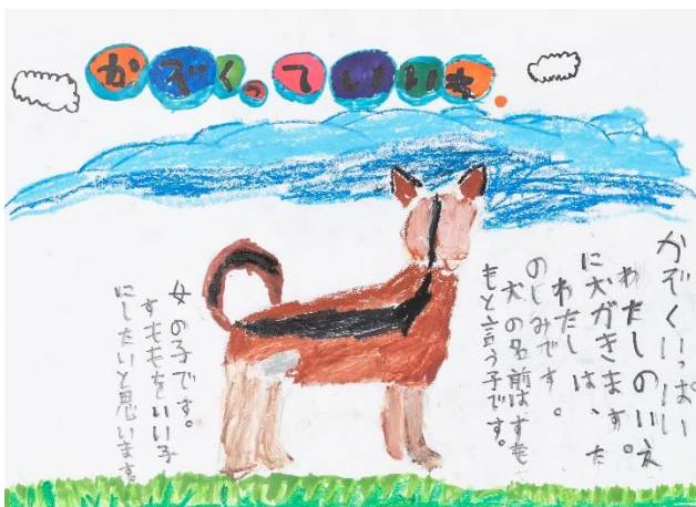
3 ウェルビーイングファミリー賞① (植田一凜・東京・8歳)