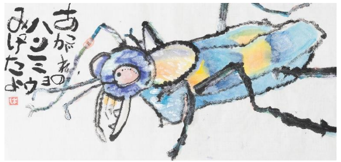
2 子どもの部 知事賞 (芳田陽紀・大阪・8歳)