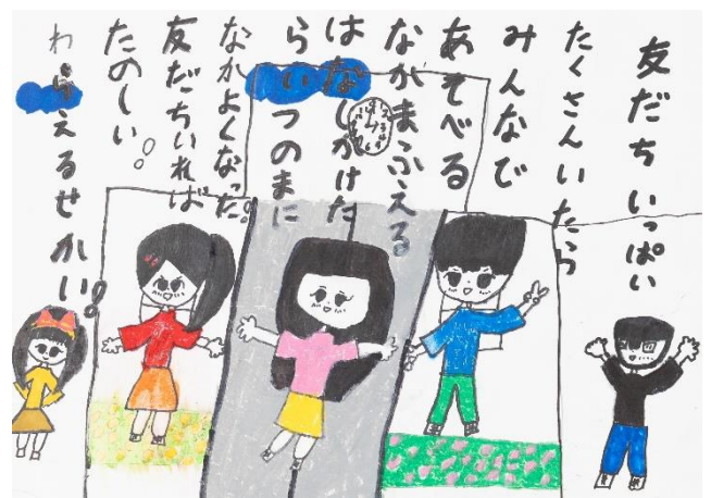
4 ウェルビーイングファミリー賞② (植田稀惺・東京・9歳)