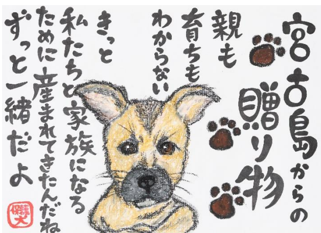
5 ウェルビーイングファミリー賞③ (植田美貴・東京・34歳)