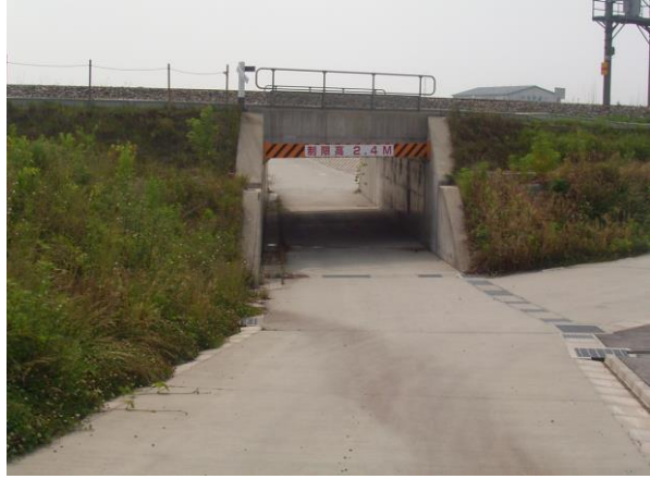
山側から海側を望む