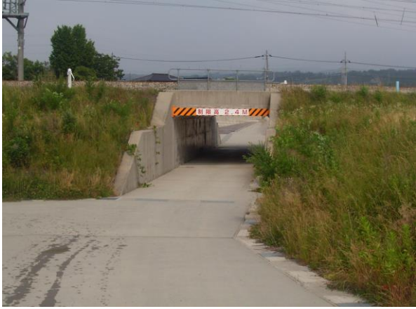
海側から山側を望む