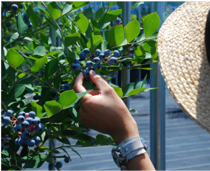
摘み取り体験サービス（観光農園）