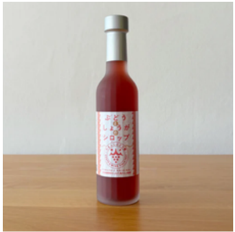
自家農産物の加工品（OEM含む）