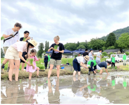
農業体験サービス