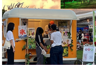
新しいサービスによる販売展開