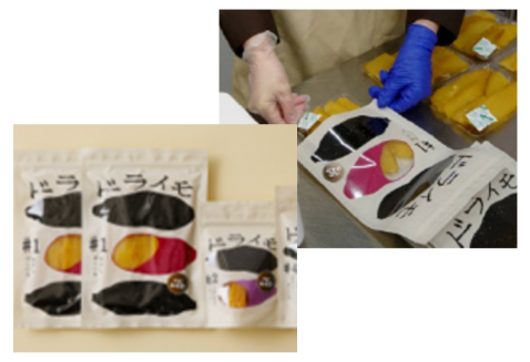
福祉と連携した商品開発