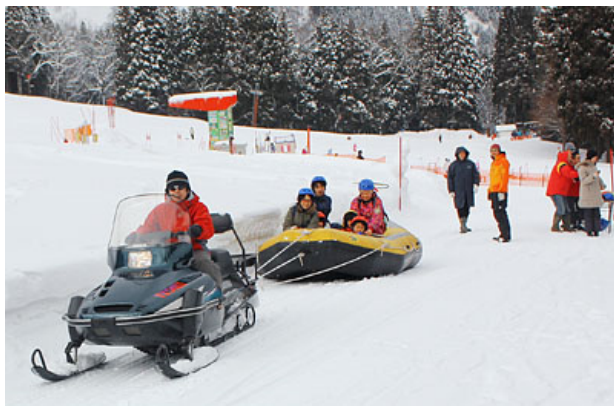
スノーラフティング