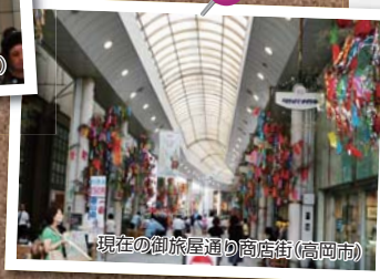
現在の御旅屋通り商店街(高岡市)