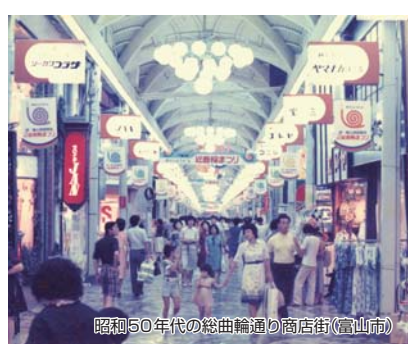
昭和50年代の総曲輪通り商店街(富山市)