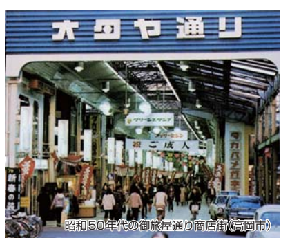
昭和50年代の御旅屋通り商店街(高岡市)