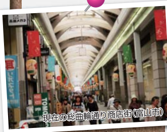
現在の総曲輪通り商店街(富山市)

また、団体に加入している商工業者が行う積極的な活動に対して必要な支援を行うことが期待されます。