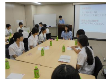
ものづくり女子育成事業(高校生向け)