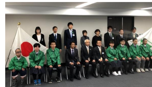
アビリンピック選手団激励会