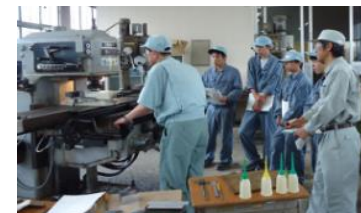
高校生に対する技能出前講座