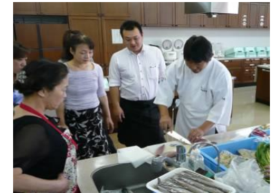
とやま観光未来創造塾