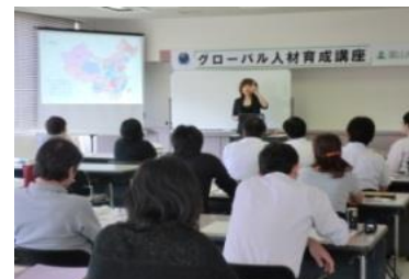
グローバル人材育成講座