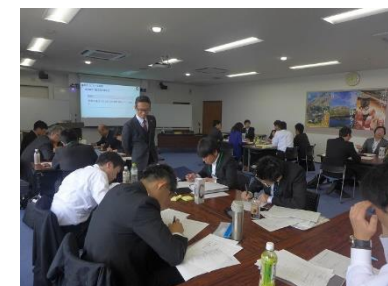
とやま中小企業人材育成カレッジ