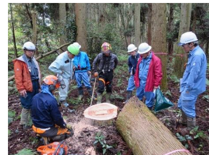
森づくりプロデューサー養成研修