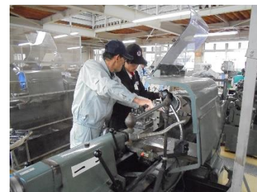
高度技能人材育成研修