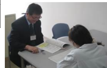
キャリアコンサルティング