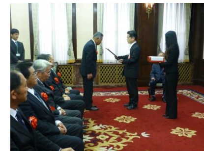
「とやまの名匠」認定式