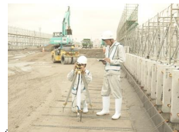
高校生インターンシップ