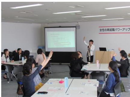
女性の再就職パワーアップ応援事業