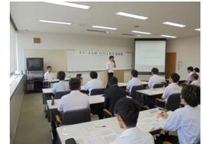
スマートものづくり人材育成研修