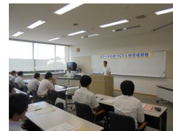
スマートものづくり人材育成研修