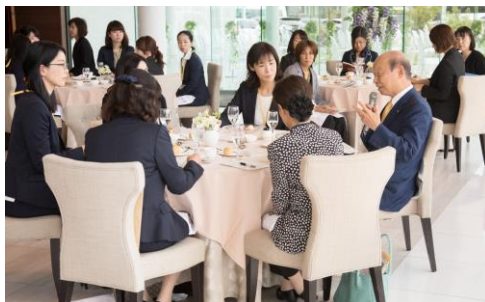
きらめく女性ネットワーク事業