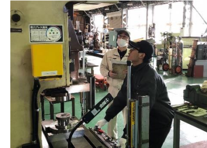
技能実習生講習(金属プレス)