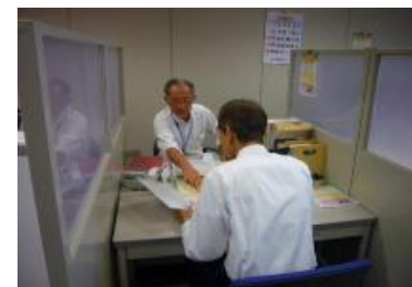
とやまシニア専門人材バンク