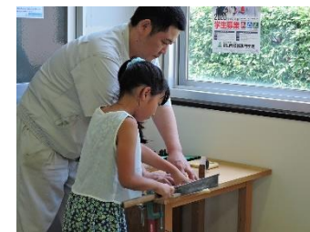
夏休みものづくり体験