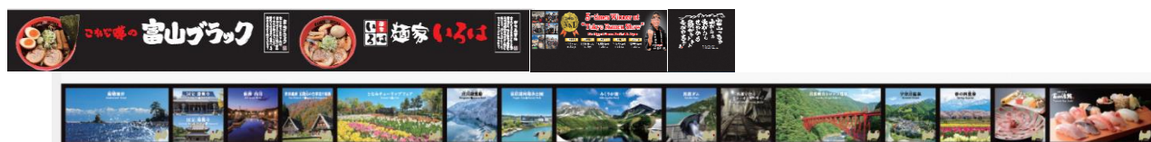
店舗壁面のイメージ