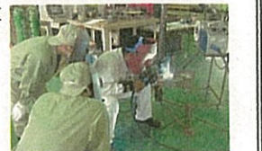
ものづくり技能人材育成