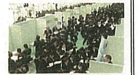
Uターンフェア イン とやま