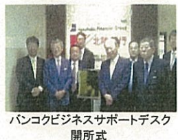
バンコクビジネスサポートデスク開所式