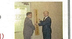
とやまシニア専門人材バンク