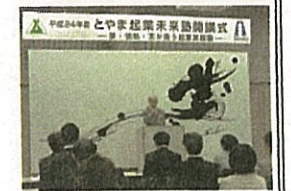
とやま起業未来塾開講式