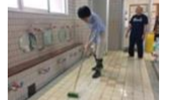
商店街での職場体験