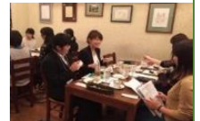
就活女子応援カフェ