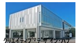
クリエイティブ・デザイン・ハブ