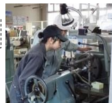
高度技能人材育成研修