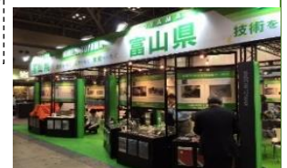
H28 機械要素技術展 富山県ブース