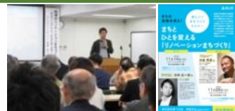
遊休資産の活用法を学ぶ「新しい!まちづくりセミナー」