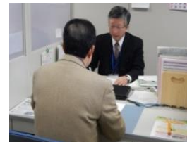
とやまシニア専門人材バンク