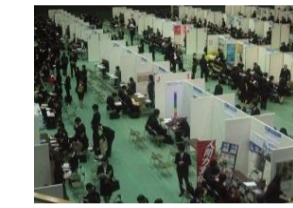
Uターンフェア イン とやま