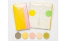
まちの逸品 商品例