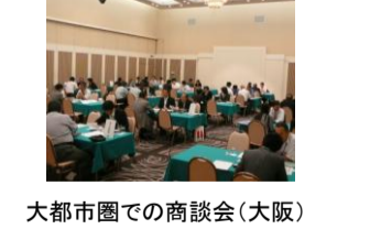
大都市圏での商談会(大阪)