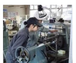
高度技能人材育成研修