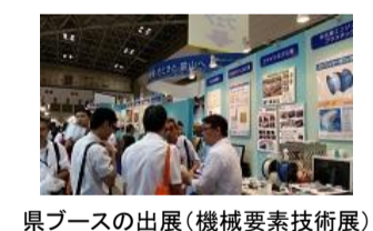
県ブースの出展(機械要素技術展)