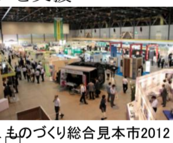
ものづくり総合見本市2012