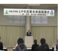
とやま起業未来塾開講式