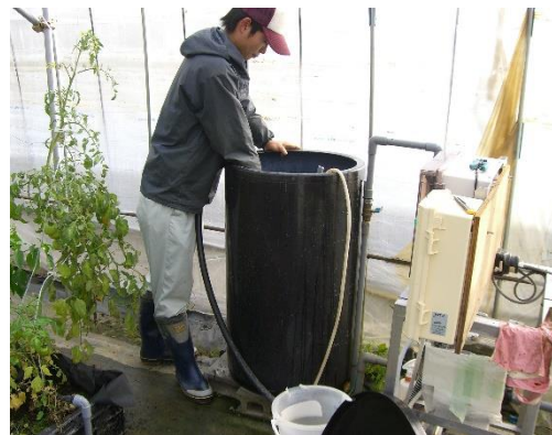
図4 養液資材の洗浄(定期的の実施)

図1、2、4出典:NPO法人 農業ナビゲーション 研究所「GAP取組支援データベース」