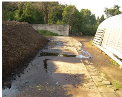
事例2 堆肥の廃汁が農地に流出