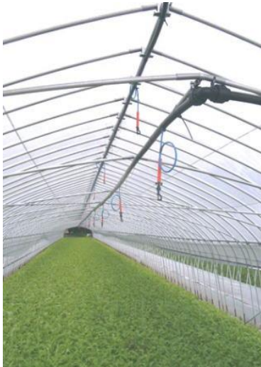
図3 頭上かん水 (収穫直前に汚染水が残っている間は使用しない)