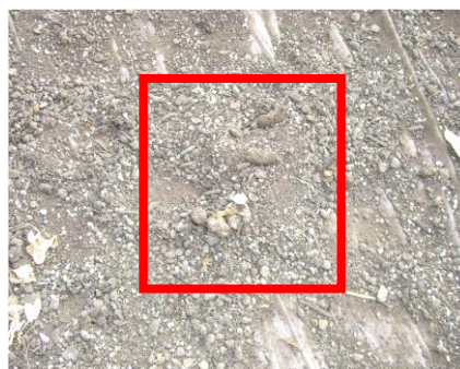
事例6 野生動物等のふん便の放置