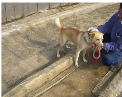
事例5 農地へのペットの持ち込み