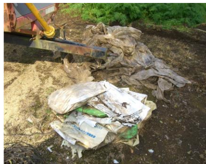
事例4 農業用資材袋の放置