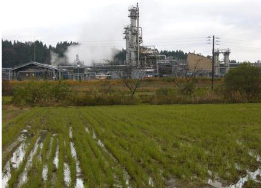
図1 汚染源の例(水源の工場排水)

注:本結果はふん便汚染の指標として検査したものであり、大腸菌の多くは病原性を有しておらず、食中毒の危険性を直ちに示すものではない。