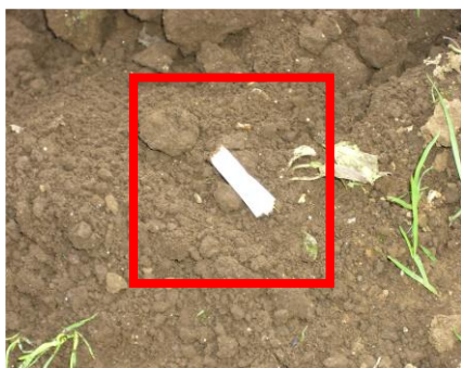
事例7 タバコの吸殻の放置