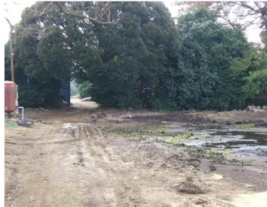
図2 汚染源の例(冠水)