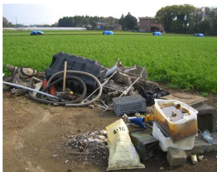
事例3 廃棄物の放置