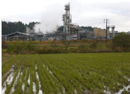
事例1 工場排水等に注意