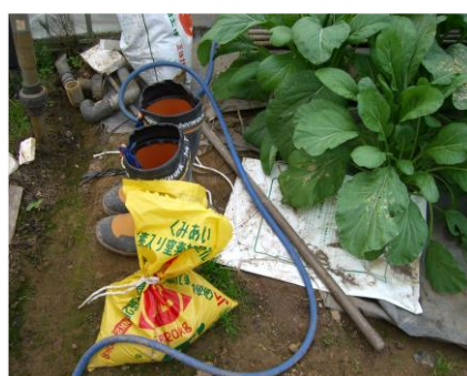
事例8 農業用資材の放置

事例出典：NPO法人 農業ナビゲーション 研究所「GAP取組支 援データベース」