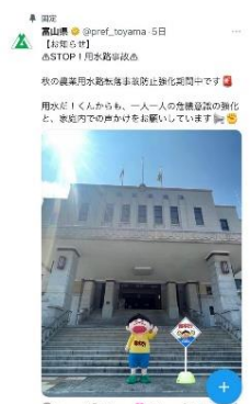
X（旧ツイッター）への掲載