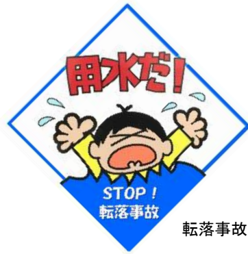
転落事故防止看板