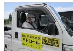
パトロール車ステッカー