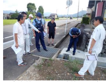
一斉点検による危険箇所の確認