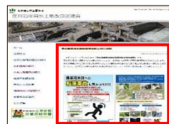
ホームページでの注意喚起