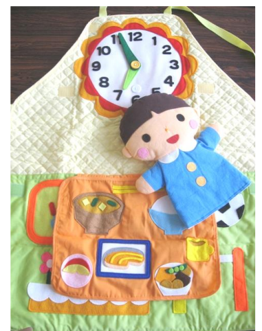
エプロンシアター

問い合わせ先・・・砺波厚生センター 企画調整班 電話 (0763) 22-3511