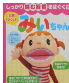
咀嚼ぱべっと (指人形)