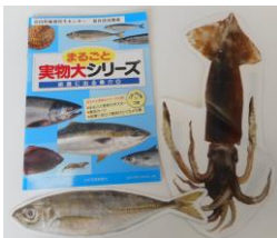
実物大カード 食材