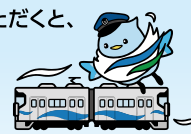
マスコットキャラクター「あいの風」