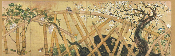
表 = 《草の実》(部分) 1931(昭和6)年 裏 = 1 《草の実》1931(昭和6)年 2 《龍巻》1933(昭和8)年 ※後期展示予定 3 《爆弾散華》1945(昭和20)年 4 《夢》1951(昭和26)年 5 《怒る富士》1944(昭和19)年 6 《香炉峰》1939(昭和14)年 ※前期展示予定 7 《龍子垣》1961(昭和36)年 ※後期展示予定 ※全て、大田区立龍子記念館蔵