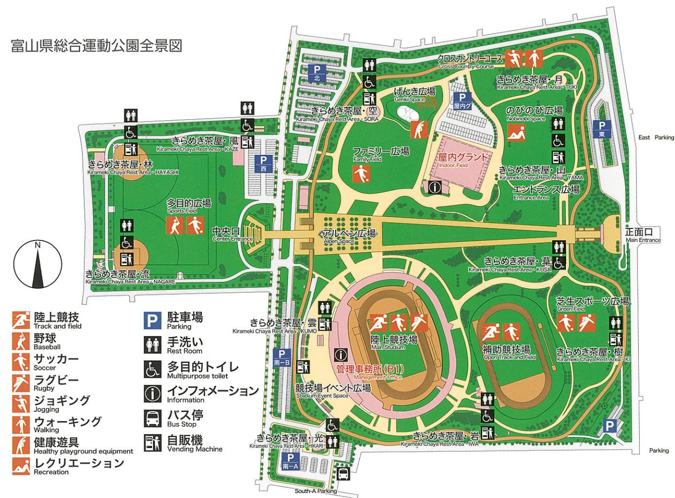
富山県総合運動公園全景図