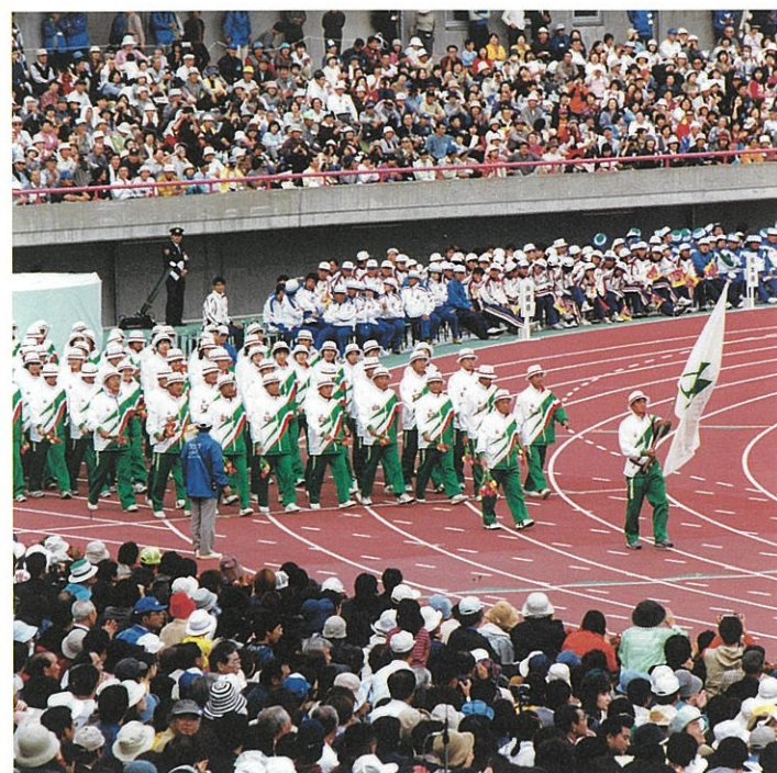
2000年とやま国体開催

総合運動公園では、誰もが気軽にスポーツや様々なレクリエーションを楽しむことができます。また、施設はスポーツ選手だけでなく、観客にも十分配慮された作りとなっており、競技者と観客とが一体となって楽しめます。