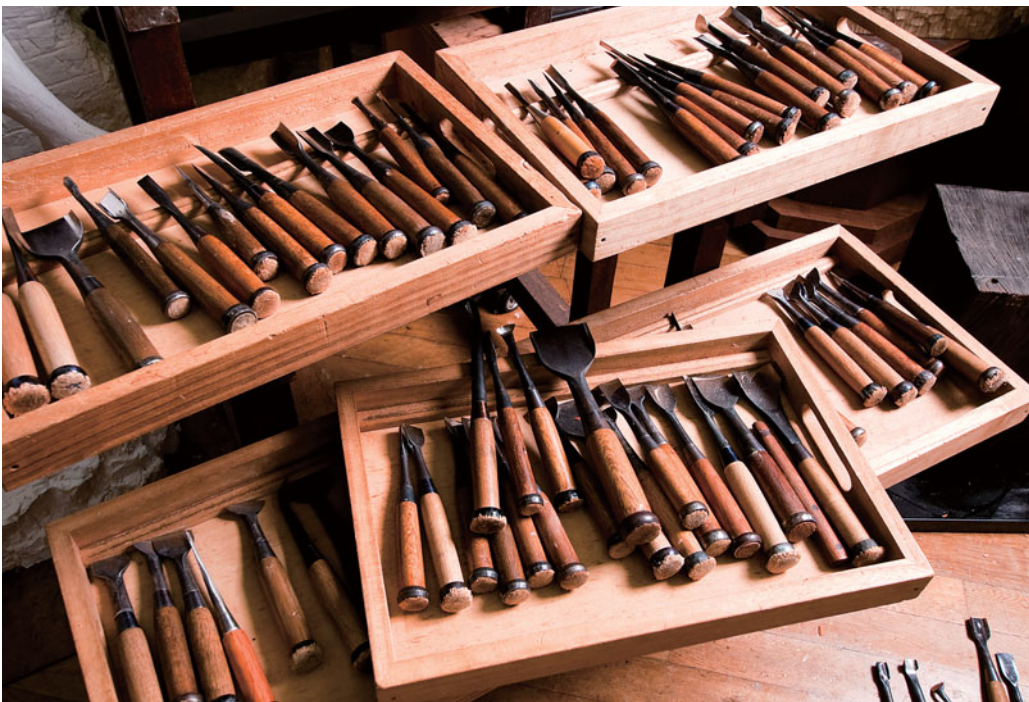
ノミと彫刻刀は200本を越す