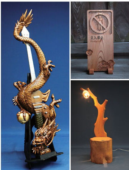
左：井波彫刻ギター「龍剣」 右上：瑞泉寺の木彫サイン 右下：井波彫刻照明付きチェア「森の木漏れ日」

「自分の感性に合った作家を見つけ、対話をしながら、納得のいくオンリーワンの作品を注文するのがおすすめ」と永井事務局長は話す。木彫りの作品は、年月を経るほどに、持ち主の息づかいがしみ込んで味わいを深めていく。やがて、持ち主の魂が木肌に表れるようになる。そのとき、彫刻は、作家と持ち主の「共同作品」となる。