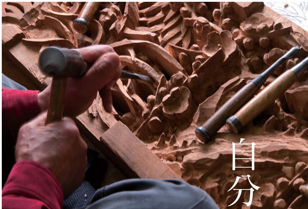
製作中の欄間は荒彫り段階