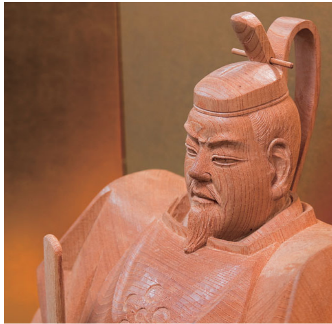
学問成就を願って飾られる天神様