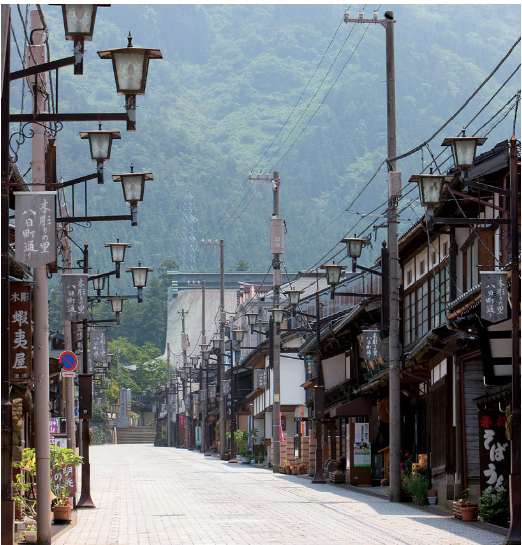
井波のメインストリート八日町通り

18世紀、宝暦の大火で焼失した瑞泉寺の堂塔再建にあたり、その彫刻を託されたのは、京都本願寺の御用彫刻師を務める前川三四郎 まへがわさんしやう 。再建なった本堂や山門を、前川三四郎は見事な彫刻で飾った。