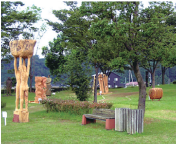
上：職業訓練校では彫刻を基礎から学ぶ 下：4年ごとに開催される「南砺市いなみ国際木彫刻キャンプ」