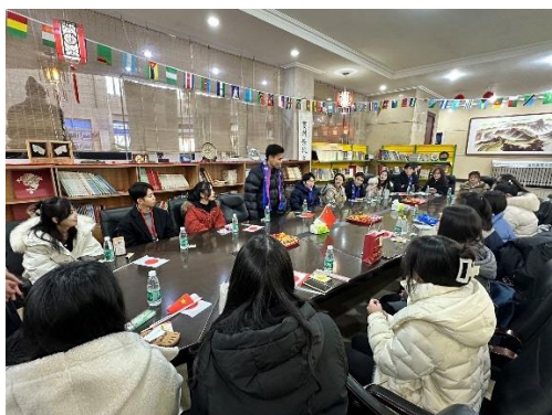
座談交流会の様子