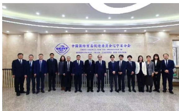
遼寧省国際貿易促進委員会の方々 との集合写真