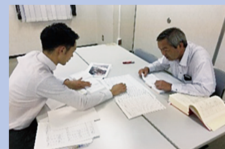
講習会（模擬査定状況） H30.10 神奈川県