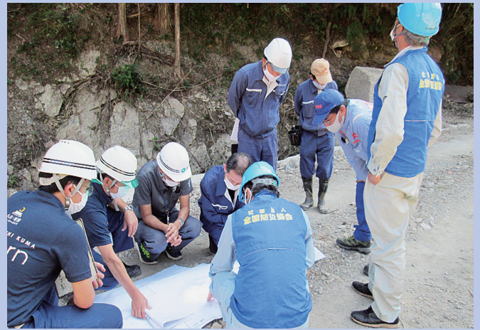
令和2年7月豪雨災害（熊本県湯前町）