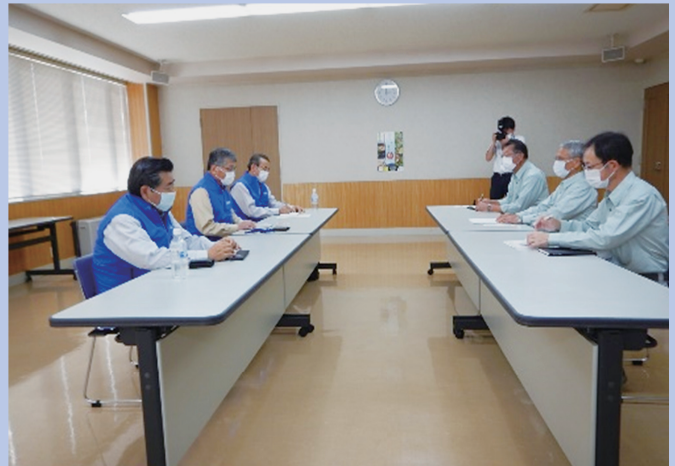
令和2年7月豪雨災害（山形県西川町）