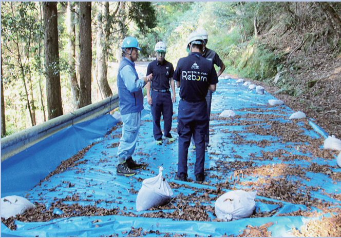
〔被災原因把握のための調査等への指導状況〕