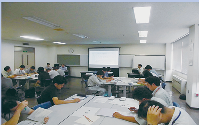
〔災害復旧事業実務研修での講師〕 H30.7 埼玉県河川砂防課