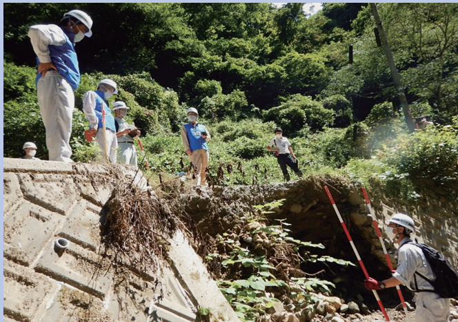
〔現地調査及び復旧工法等に関する技術的な指導状況〕