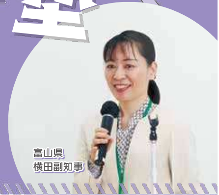
富山県 横田副知事

県内企業等における女性の活躍を一層推進するため、リーダーをめざす女性社員等の相互交流と自己研鑽を図り、業種・職種の枠を超えたネットワークを構築する「煌めく女性リーダー塾」の塾生を募集します。