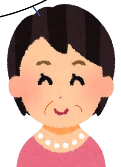
高見スーパーバイザー