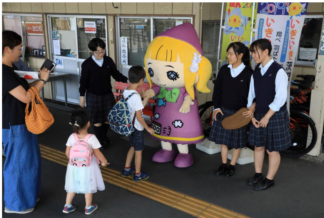
鉄道と地域の活性化のお手伝い

ひたちなか市非公認キャラクター「みなとちゃん」 (この他、インターンシップ受入)