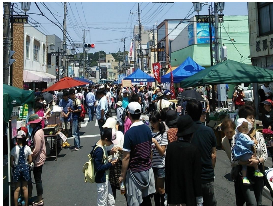
連携イベントで人があふれる商店街