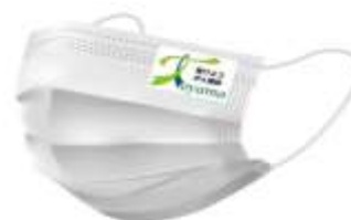
【啓発マスク（ワンポイントシール）】