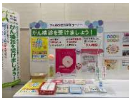
R3年度 がん検診啓発用ブースの様子