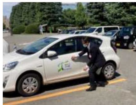
R4年度 がん協定締結企業とのがん検診受診率向上コラボレーション事業の活動風景