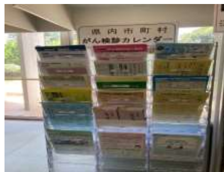
R4年度 がんに関する展示の様子(フレイル予防に関する展示の一部)