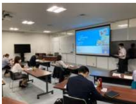
R4年度 出前セミナー