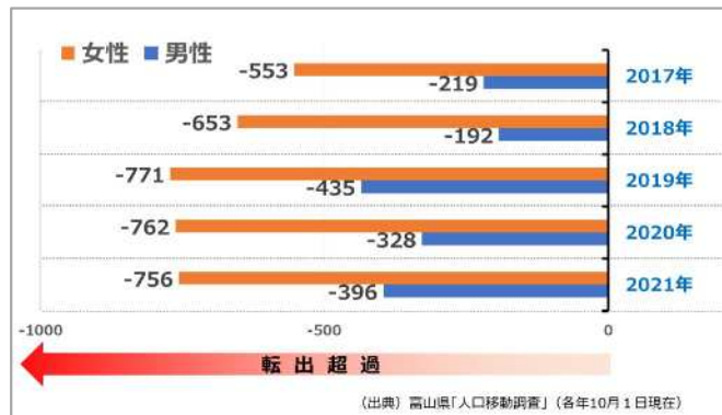
富山県 20～24歳の社会移動の状況（日本人のみ）

また、本県の出生数は、6,076 人で過去最少（令和3年）、出生数と関係が深い婚姻件数も3,548組で過去最少（同）となっています。これは、若い年代、特に就職期にある若い女性が富山県を選ばないため、転入より転出が大きくなっており、その結果、20代の男女数が不均衡な状態になっていることが背景にあると考えられます。このため、若い年代、特に県外流出の大きい女性や子育て世代に選ばれる環境づくりを喫緊の課題として、就職期の女性が富山県で就職し、生活したくなるような環境づくりや、企業の働き方改革・意識改革、子育て環境の改善、男性の家庭と仕事の両立支援を進めます。