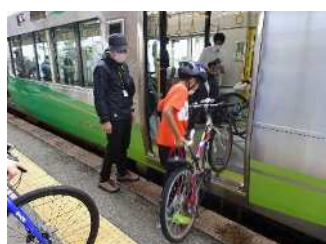
自転車を分解せずそのまま乗車