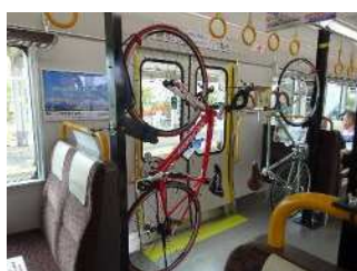
縦置きサイクルラック