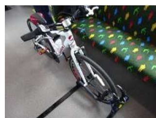
横置きサイクルラック