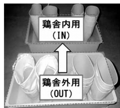
図4 交差汚染防止対策(案)