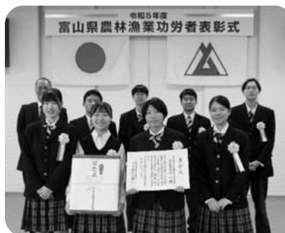
富山県立中央農業高等学校 畜産専攻チーム

さらに、令和5年5月に富山市内で開催されたG7教育大臣会合においては、夕食会のメインディッシュとして、同校の生徒が育てた「とやま和牛 酒粕育ち」が各国要人らに提供され大変な好評を得ており、品質の高さと高校の取り組みをアピールしたことなどにより、本県畜産業の振興に寄与しているとして表彰状が授与されました。おめでとうございます。