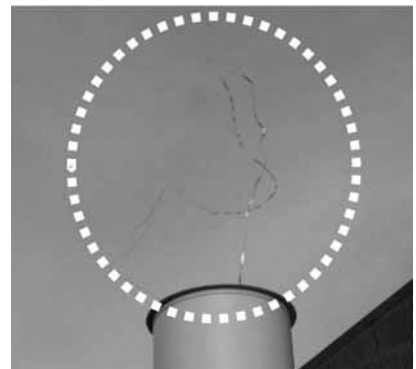
ジェットノズルからの排出状況をテープ（白点線内）で実証