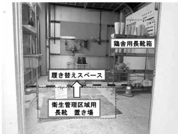
図2 交差汚染防止対策(実例①)

図2は、交差汚染防止対策を講じている農場の実例です。この例ではポールを用いて物理的に区分しており、図3では、鶏舎用長靴置き場には赤くライン(図では黒線で示す)を引くことで視覚的に区分しています。どちらの例も、だれもが理解でき、さらに従業員が利用しやすい、という点で優れていると思われます。