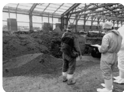
畜産環境保全強化月間巡回の様子

また、養豚農場についても、東部管内は9月から巡回を行っており、西部管内も11月から巡回を行う予定にしております。あわせて、河川や沿岸海域等へ畜産由来の排水を放流する場合、水質汚濁防止法による排水基準値をクリアする必要があるため、浄化処理を行っている養豚農場の水質検査(硝酸性窒素等の値 他)も行っています。今後も管理基準に従って適切な管理をしてください。