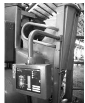
搾乳結果のデータを収集し、モニターに提示