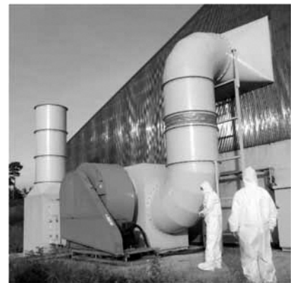
CS大気チャンバーシステム

良質堆肥を生産するためには、悪臭の原因となる好気性発酵の過程は必要不可欠であることから、堆肥舎を密閉し、堆肥舎内のガスを集めて、薬剤や空気混合等により臭気を軽減した上で、できるだけ上空へ拡散させる本方法は、臭気の希釈効果を高めることができ、悪臭対策の有効な方法と思われました。