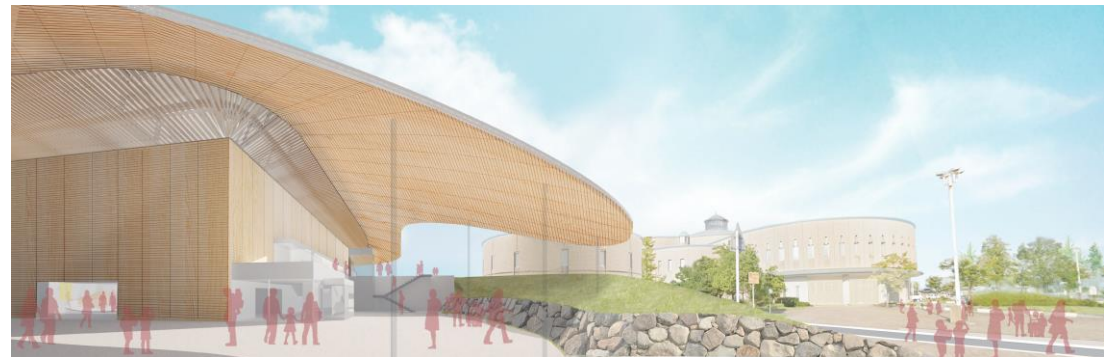
高岡テクノドーム別館（イメージ）