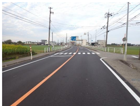
道路の舗装補修(補修後)

環境保全、地域活性化などの一般会計事業等を支援するため、電気事業会計の利益剰余金を繰出すもの