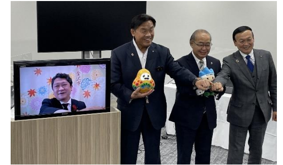
開催県・市四者による意見交換

本県の観光資源や食などの魅力発信につなげるため、首都圏のアンテナショップにおいて、関係閣僚会合を開催する他の自治体と連携したPRを実施