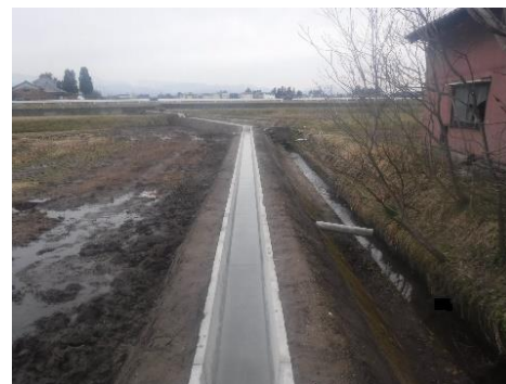
農業用水路の改修