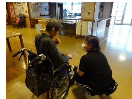
介護サービスの提供

職員が新型コロナに感染したことにより休業を余儀なくされた医療機関に対し、休業補償に係る経費を増額