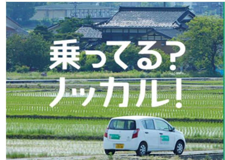
「ノッカルあさひまち」 7