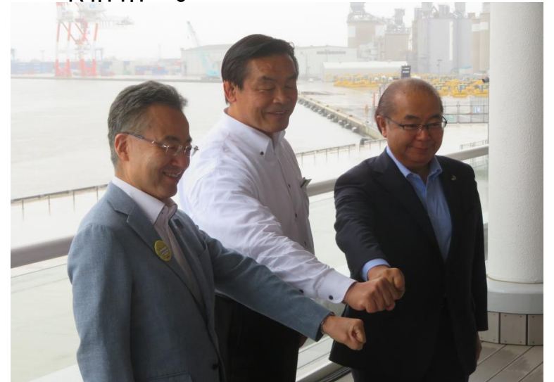
杉本福井県知事・馳石川県知事と懇談 R4.7.21(金沢市)