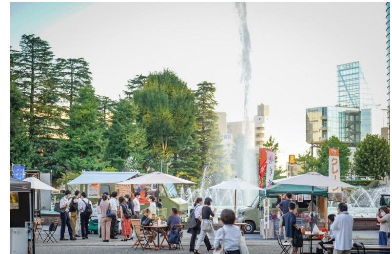
官民連携人材育成事業による実証実験 県庁前公園で「ケンチョウマルシェ」開催