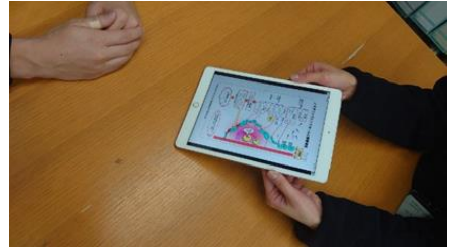
データを活用した特定保健指導