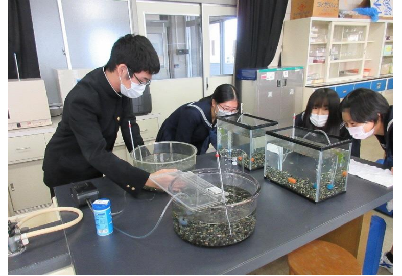
県立高校におけるプロジェクト学習 (マイクロプラスチックがメダカに与える影響)