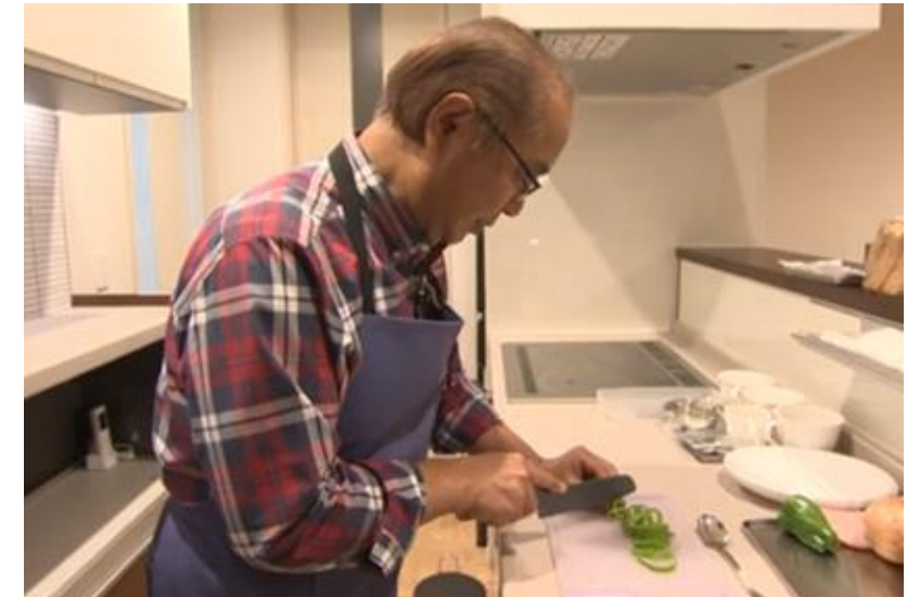
家事・育児シェアリングプロジェクト