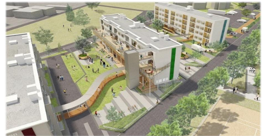
創業支援センター、創業・移住促進住宅 R4.10.28オープン