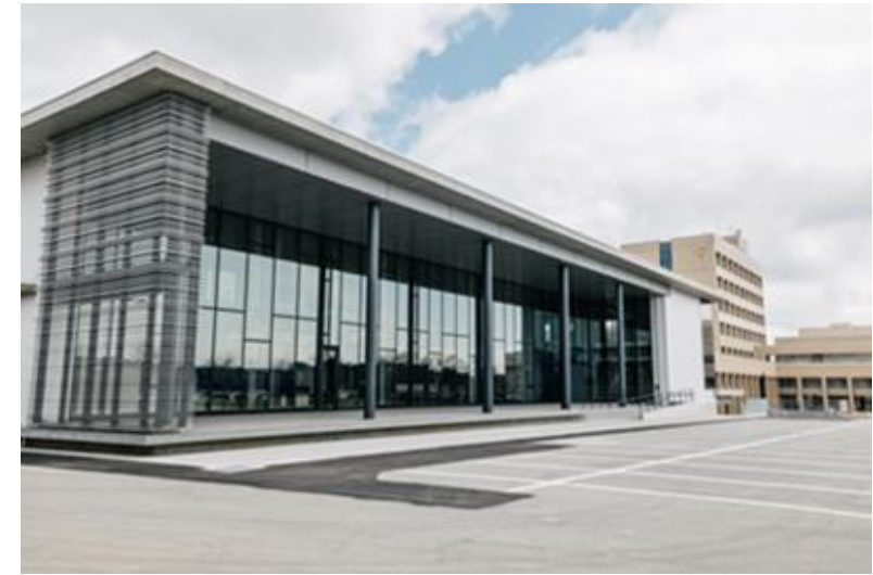
DX教育研究センター（R4.4月供用開始）