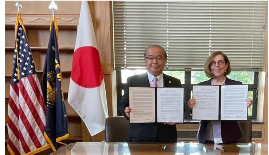
ケイト・ブラウン オレゴン州知事と懇談、MOU締結 R4.8.4