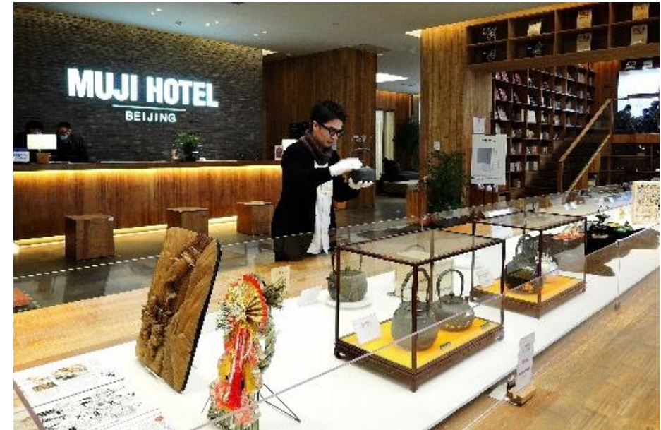
伝統工芸品展示会の様子 (令和3年度 北京)