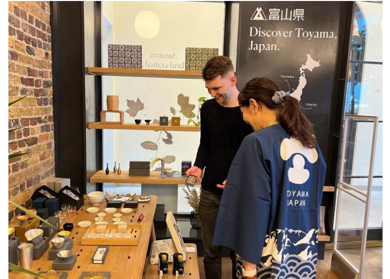
ロンドンにおける富裕層向け観光物産PR R4.11.1～6