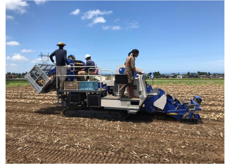
たまねぎハーベスターによる収穫作業