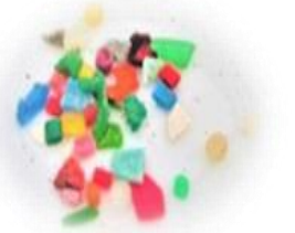
マイクロプラスチック