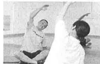
運動時のイメージ