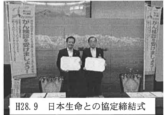
H28.9 日本生命との協定締結式