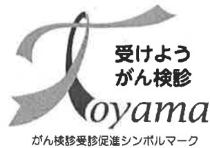
がん検診受診促進シンボルマーク

カーネーションとがん検診の説明付きメッセージカードを、帰宅途中の中高生等に配布し、家庭内でがん検診の受診を呼び掛けてもらう。