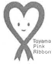
ピンクリボン 富山県オリジナルマーク