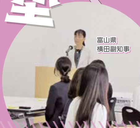
富山県 横田副知事

県内企業等における女性の活躍を一層推進するため、リーダーをめざす女性社員等の相互交流と自己研鑽を図り、業種・職種の枠を超えたネットワークを構築する「煌めく女性リーダー塾」の塾生を募集します。