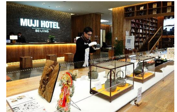
伝統工芸品展示会の様子 (令和3年度 北京)