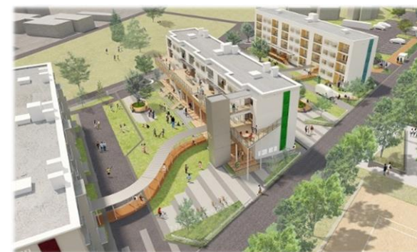
創業支援センター、創業・移住 促進住宅（イメージ）

全国でも先駆的な職住一体の施設を、富山市蓮町にオープン 多くの起業家や移住者を呼び込み、ヒト・モノ・コトが交流する拠点として運営