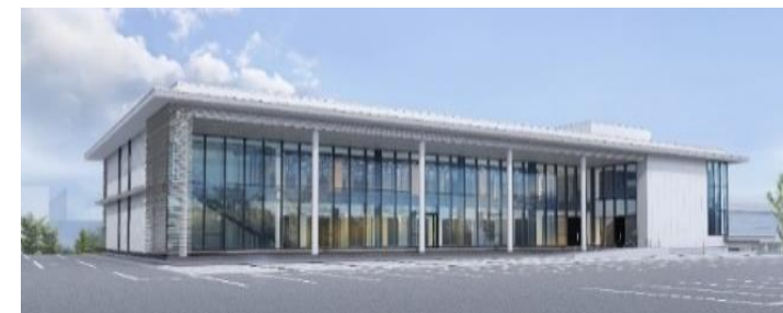
県大DX教育研究センター（仮称） （イメージ）

DX教育研究センター（仮称）において、産学官金の連携教育拠点としてDXを担う人材育成と研究を推進