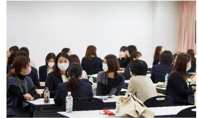
女性リーダー養成講座の様子