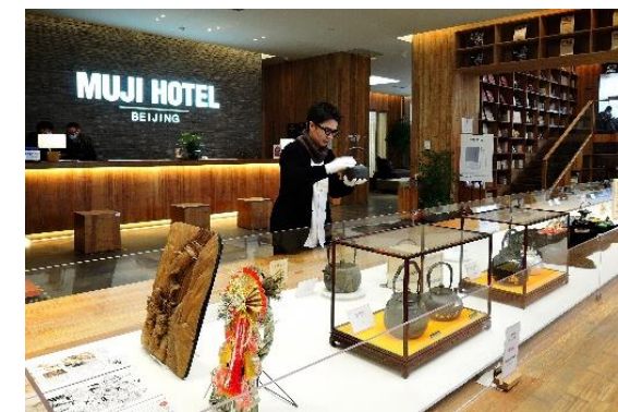
伝統工芸品展示会の様子 (令和3年度 北京)

伝統工芸品や職人の動画制作、中国北京での展示会や越境ECサイトと連動したプロモーションを実施