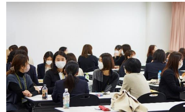
女性リーダー養成講座の様子