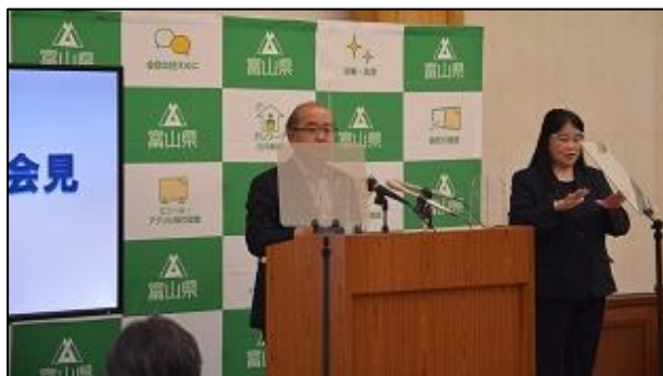
緊急記者会見での手話通訳