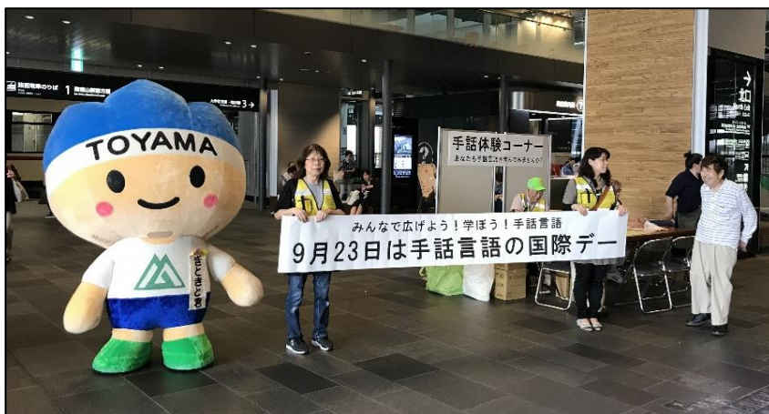
手話言語の国際デー街頭キャンペーン

イベント等への手話コーラスの派遣、手話体験カフェの開催、街頭キャンペーン等により、手話の魅力を発信し、県民の理解促進を図る。(R1～)