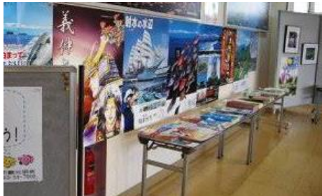
観光ポスター・イベント案内の掲示