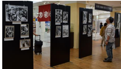
写真・パネル展示