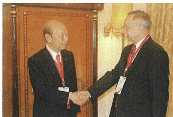
ベグロフ 知事代行との握手