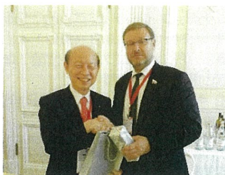
コサチョフ ロシア連邦院委員長との握手