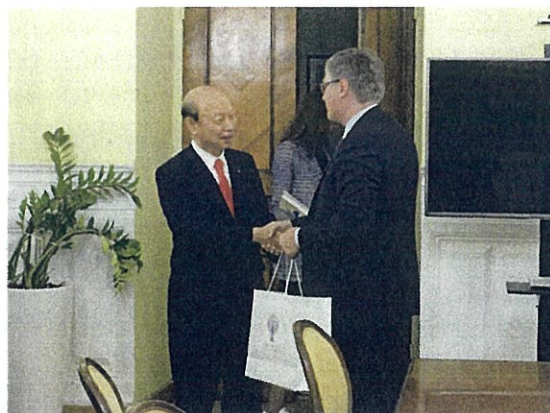
ステパノフ文化省次官との握手