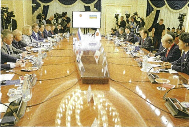
ロシア連邦院での意見交換