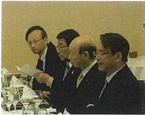
大使公邸での夕食会