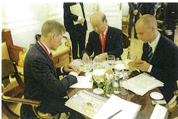
コジェミャコ沿海州知事（左）との会談