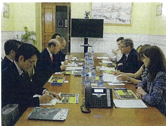
ステパノフ文化省次官との会談