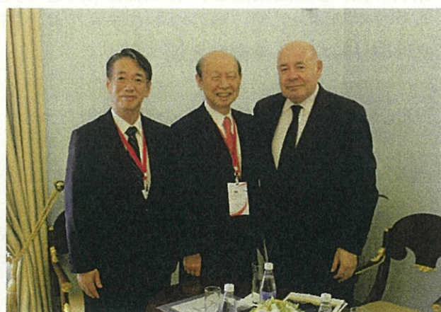
シュヴィトコイ大統領特別代表、上月大使との記念写真