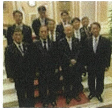
大使公邸で記念撮影