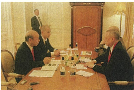
ベグロフ知事代行との会談