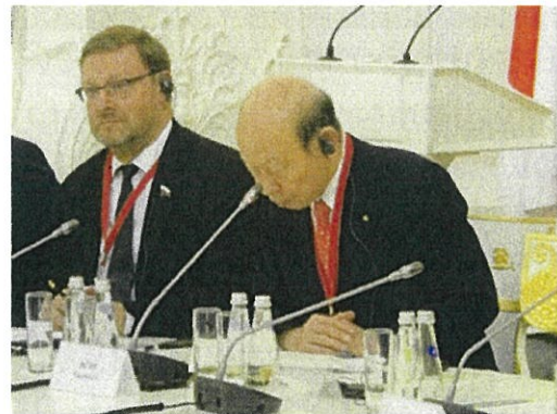
石井知事の発言の様子。左はコサチョフ ロシア連邦院国際問題委員長