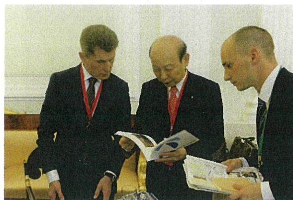
富山県美術館の収蔵作品図録の説明