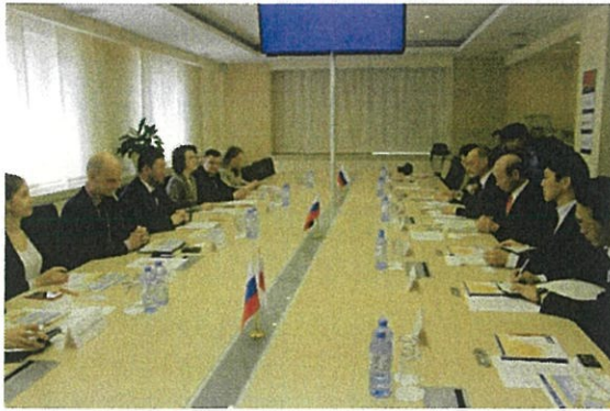
イスリンFESCO社長との会談