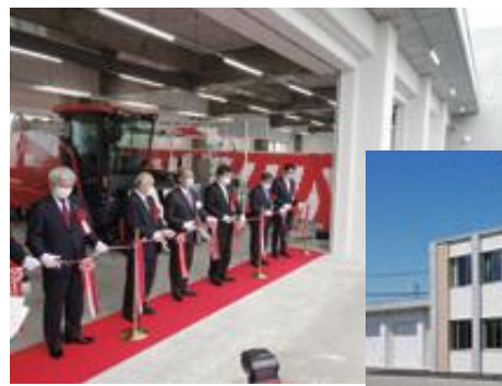
スマート農業普及センター本館

本施設では、各種スマート農機を展示するほか、100人規模の研修会が可能です。また、シミュレータ室では、ドローン操作やトラクタ作業を体感でき、ほ場での操作を初心者から経験者まで段階に応じて研修できるほか、「経営管理システム」を活用したほ場管理作業などのデータの解析・活用の実習も可能です。さらに、農機メーカー等が開催するスマート農機の実演会や研修会等の場としても活用していくこととしています。ぜひご利用ください。