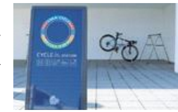
サイクルステーション(道の駅「雨晴」)

これらのコースを快適に走行できるよう、バイクラックの設置や空気入れの貸出しなどのサービスを提供する道の駅などを「サイクルステーション」、喫茶店などを「サイクル・カフェ」として整備・認定しています。