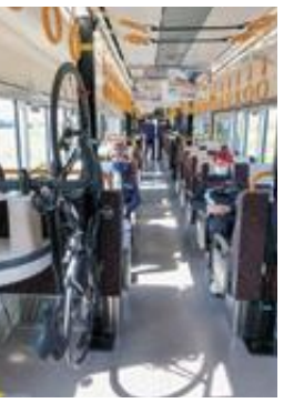
あいの風サイクルトレイン

あいの風とやま鉄道では、東富山駅・滑川駅から乗車して、泊駅で折り返し、入善駅・黒部駅で降車する「あいの風サイクルトレイン」を運行しています。