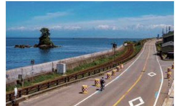
雨晴から望む海越しの立山連峰(富山湾岸サイクリングコース)

これまでに3ルートが指定され、令和3年5月に富山湾岸サイクリングコースを含む3ルートが新たに指定されました。