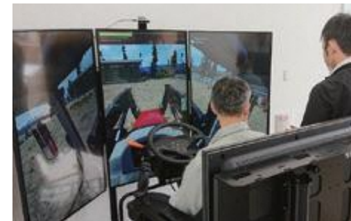
日本初!! トラクタ運転シミュレータ