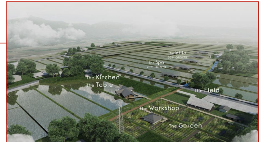
立山町「ヘルジアンウッド」 都会的感覚と美しい田園風景の融合