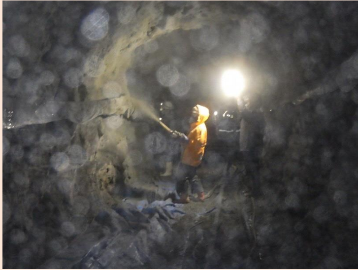
上部軌道トンネル モルタル吹付作業状況