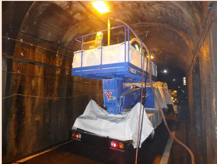
黒部トンネル 背面モルタル注入作業状況