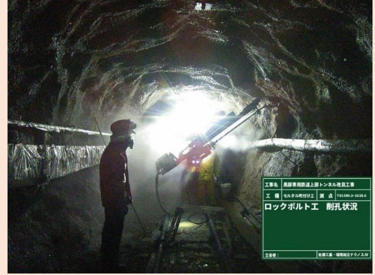
上部軌道トンネル ロックボルト削孔作業状況