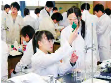
とやま科学オリンピック