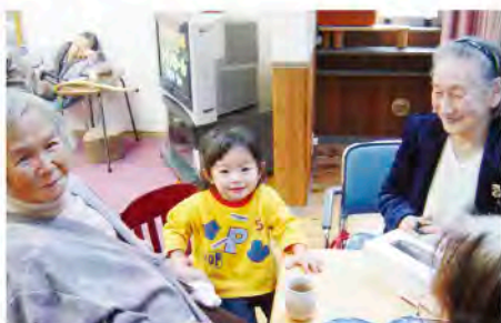
富山型デイサービス