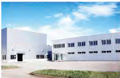
富山県ものづくり研究開発センター

● 外国人宿泊者数 現状値…58,900人(速報値) (2011(H23)年) ▼ 目標値…180,000人以上 (2021(H33)年)