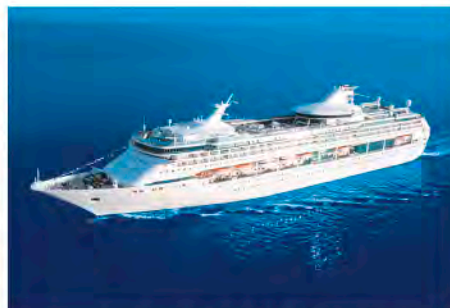
伏木富山港に寄港する大型クルーズ客船