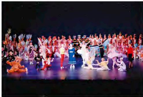
とやま世界子ども舞台芸術祭