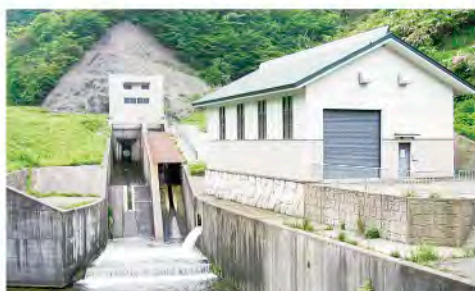
農業用水を利用した小水力発電所