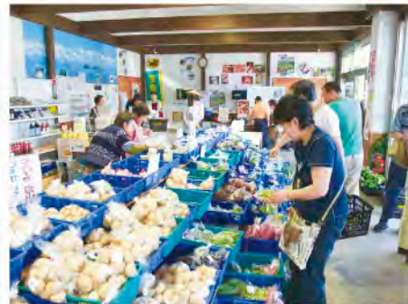
農産物・加工品の直売施設