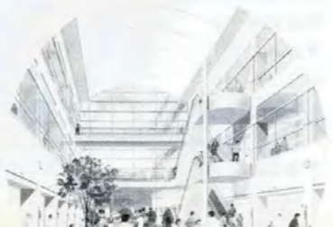
安らぎ空間 「緑のホール」

今後、既存の病棟の解体撤去工事、改修等を行ったうえで引続き第二期工事として外来診療棟、中央診療棟の工事に着手します。 新しい病院は平成七年度に完成する予定です。 工事期間中は、現在地での改築のためなにかと、ご不便をかける点もあると思われますがよろしく願います。 なお、新病棟は、六月一日オープンのため五月三十一日（日）に移転作業を実施します。 当日は、混雑が予想されますので、救急医療は他の医療機関をご利用願います。また、入院患者さんへの面会についてもご遠慮下さるようお願いいたします。