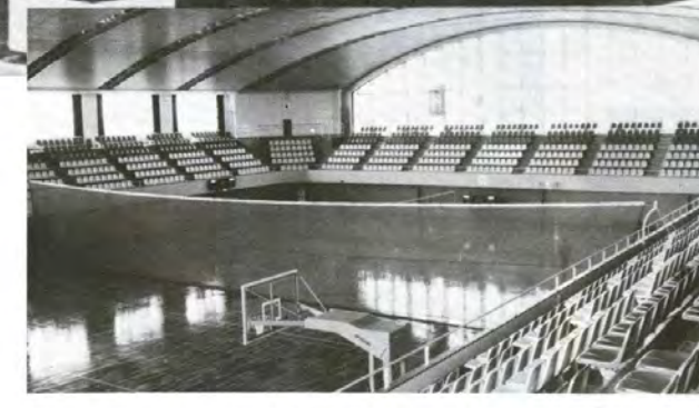
▲大アリーナ棟は国際級の施設