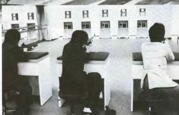
◀人気のビームライフル