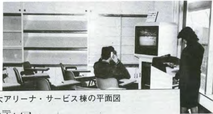
▼情報相談コーナーは気軽に利用できます。