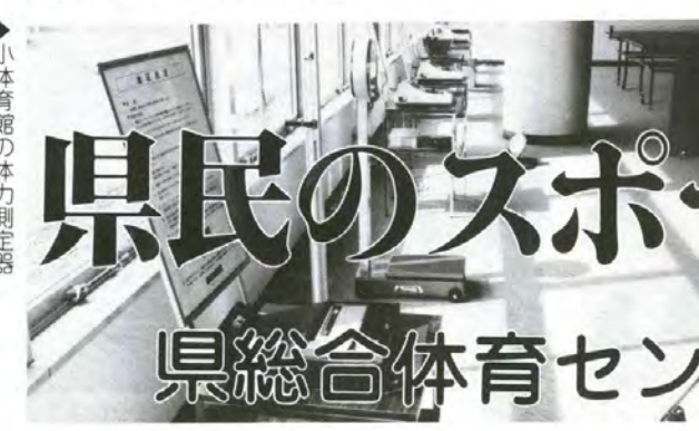
▶小体育館の体力測定器

待望の富山県総合体育センターが、いよいよオープン、空の玄関口富山空港に隣接して、その偉容を誇っています。 置県百年記念事業の一環として建設が進められていたもので、国際的な競技会も開催できる、健康とスポーツ日本一に挑戦する県のスポーツ振興と普及の拠点となるにふさわしい施設です。