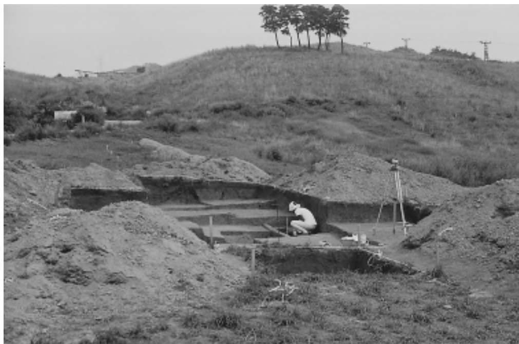
調査中の直坂遺跡

旧石器時代、縄文時代草創期、縄文時代早期から縄文時代中期に時代の中心を持つ集落の遺跡です。特に旧石器時代の石器の種類はバラエティに富み、研究者には非常に著名な富山県を代表する旧石器時代の遺跡です。また、昭和47年の調査で出土した縄文時代早期の回転押型文土器は信州、飛騨、東海地方との強い関連性が指摘されています。