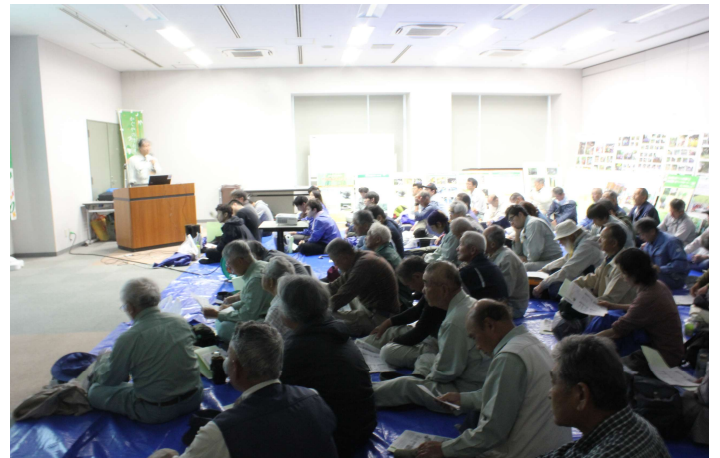
竹資源ネットワーク講習会では、改めて室内で竹の安全な伐採方法や竹資源の利用方法を説明