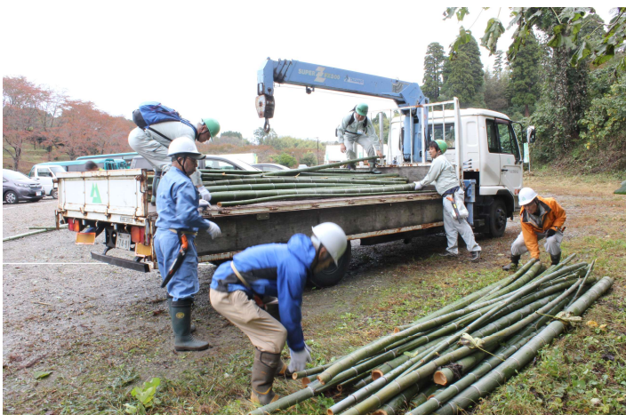
かぐやの竹舟号（竹材回収車）へ伐採した竹を積み込み、紙の原料として有効利用