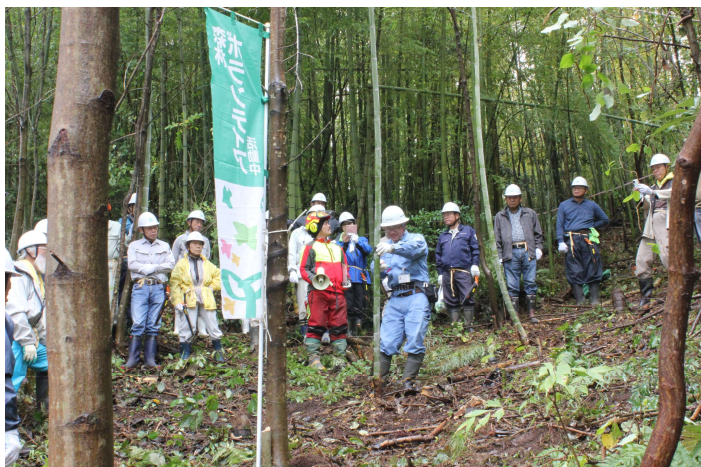
竹は伐採時に裂けて危険をとまなうため、安全な伐採方法を説明