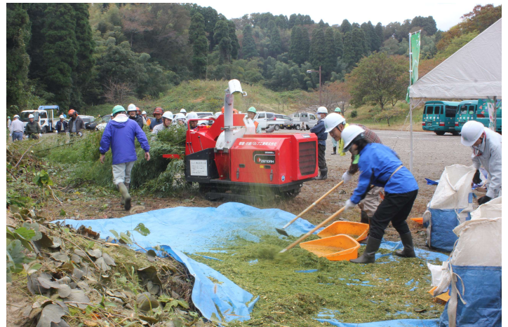
伐採した竹を活用するため、チップパー機により破碎し、遊歩道に竹チップを散布