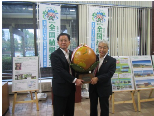
木製地球儀手渡しの様子（右が高岡市長）