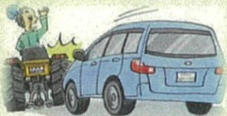
トラクタの公道走行