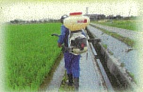
用水路沿いの動噴散布作業