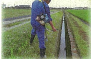
用水路沿いの草刈り