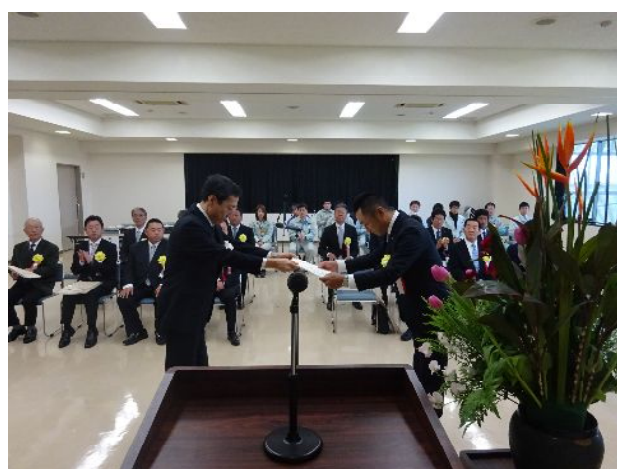
土地改良部門 表彰