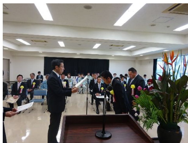
治山林道部門 表彰