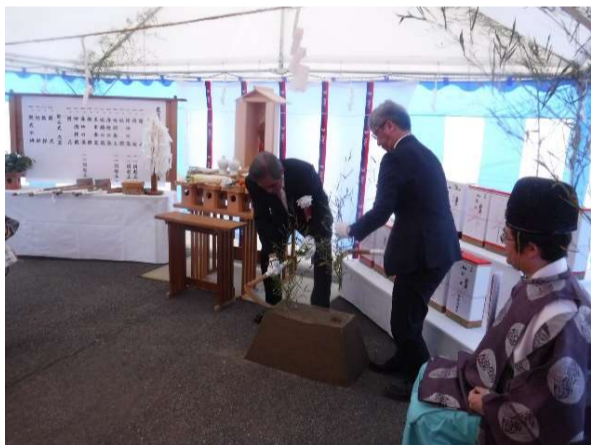
起工式・安全祈願祭の様子

そうした中、令和4年度にまず「小坂一期地区」として46.0ha、そして本年度に「小坂二期地区」として40.7haの併せて86.7haを「小坂地区」として取り組むことになってまいります。本地区は、スマート農業の実現を目指し、スマートフォン、タブレットを活用した水管理やロボット草刈り機に適した畦畔勾配にて設計を進めており、農業の省力化に先進的に取り組まれております。地元関係者の方々には本事業に大変期待を寄せておられました。