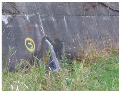
庄川サイホンからの漏水