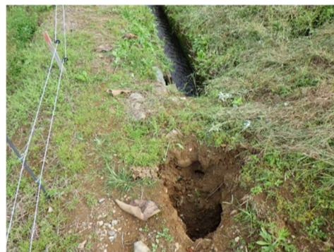
吸出しによる陥没