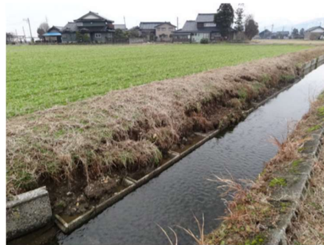
水路老朽化による側壁の倒壊