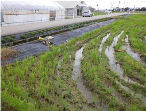
水路老朽化による漏水