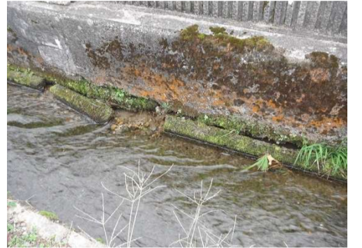
劣化による用水路側壁の破損